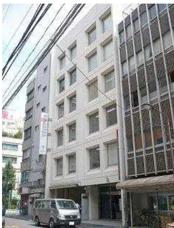
ミツボシ第3ビル2階