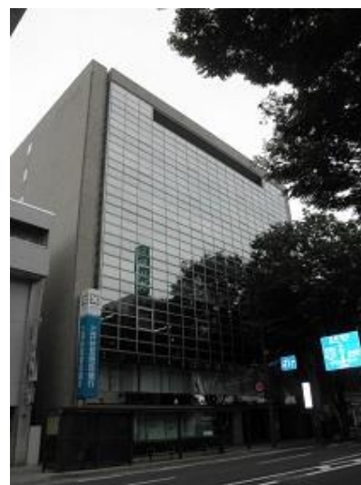
前橋本町スクエアビル3階・8階