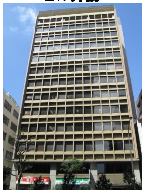
御成門郵船ビル7階